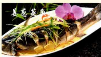
73. Fu Ji gedämpfter Fisch 20 Minuten warte Zeit CHF 39.00