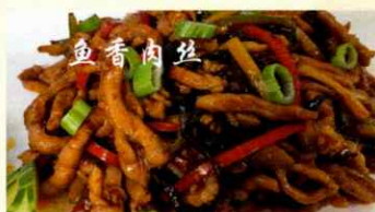
70. "Schwein à la Fisch" chinesisches Schweinefleisch- gericht ohne Fisch , scharf, süß, sauer, frisch, salzig, aromatisch. CHF 31.00