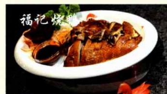
60. Fu Ji knusprig grillierte Ente (1/2 Ente) CHF 36.00