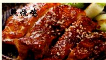
80. Gebratene Pouletschenkel an japanischer Teriyaki Saucese mit Gemüse CHF 32.00