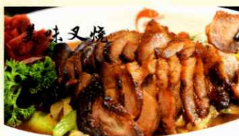
71. Schweinebraten Grillierter & mariniertes Schweinespeck mit Wok Gemüse CHF 29.00