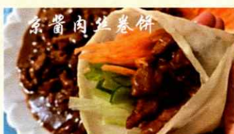
76. Sautiertes Schweinefleisch in süßer Bohnensauce service mit Pfannkuchen CHF 38.00