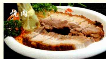
75. Knuspriges geschmortes Schweinebauch CHF 29.00