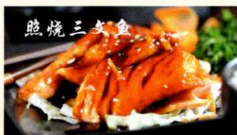
81. Lachs an japanischer Teriyaki Sauce mit Gemüse CHF 33.00