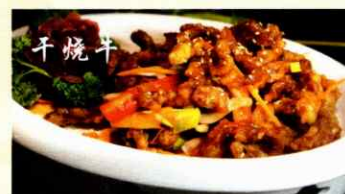
72. Knuspriges Rindfleischstreifen (süß-scharf) CHF 29.00