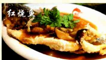
74. Chinese Braised Fish (Hong Shao Yu) CHF 39.00